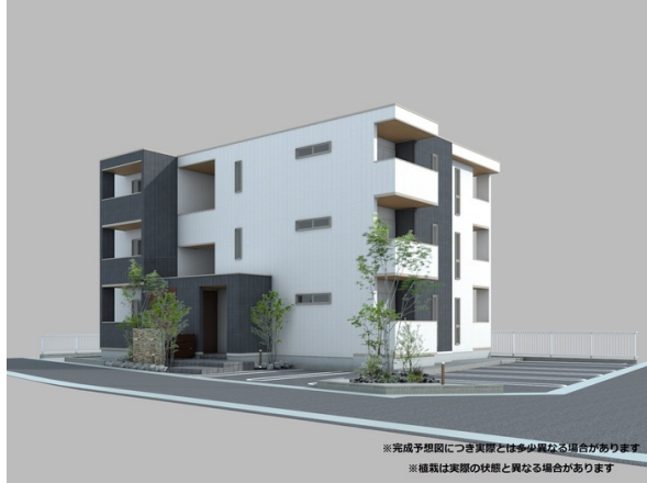
※完成予想図につき実際と多少異なる場合があります ※仕様は実際の状態と異なる場合があります