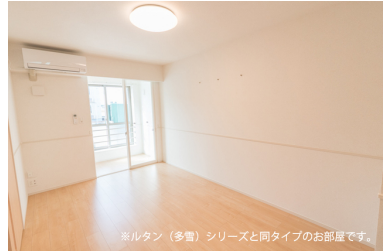
※ルタン（多量）シリーズと同タイプのお部屋です。