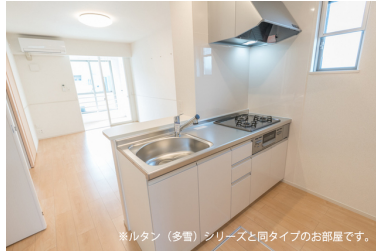
※ルタン（多量）シリーズと同タイプのお部屋です。