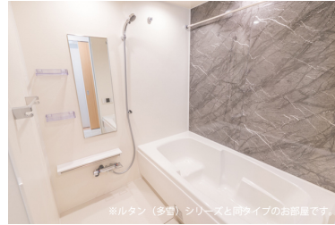
※ルタン（多量）シリーズと同タイプのお部屋です。