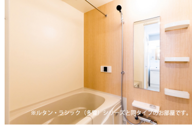
※ルタン・ラシック (多電) シリーズと同タイプのお部屋です。