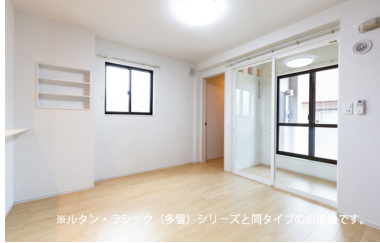
※ルタン・ラシック (多電) シリーズと同タイプのお部屋です。