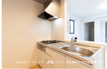
※ルタン・ラシック (多電) シリーズと同タイプのお部屋です。