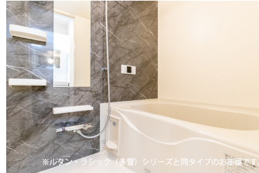
※ルタン・ラジック（多量）シリーズと同タイプのお部屋です。