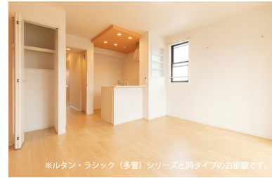
※ルタン・ラシック（多官）シリーズと同タイプのお部屋です。