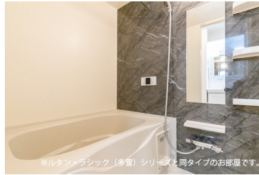
※ルタン・ラシック（多官）シリーズと同タイプのお部屋です。