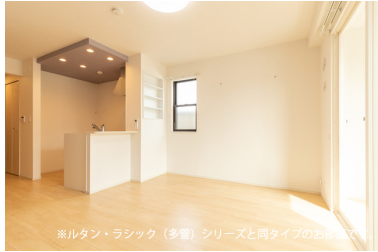
※ルタン・ラシック（多量）シリーズと同タイプのお部屋です。