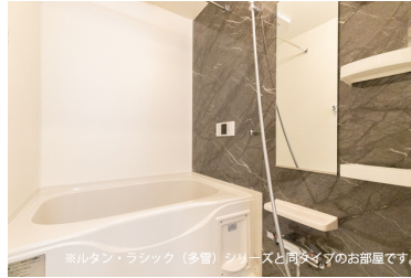
※ルタン・ラシック（多量）シリーズと同タイプのお部屋です。