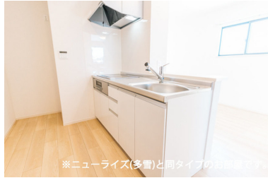
※ニューライズ(多量)と同タイプのお部屋です。