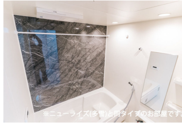
※ニューライズ(多量)と同タイプのお部屋です。