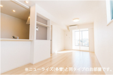
※ニューライズ(多量)と同タイプのお部屋です。